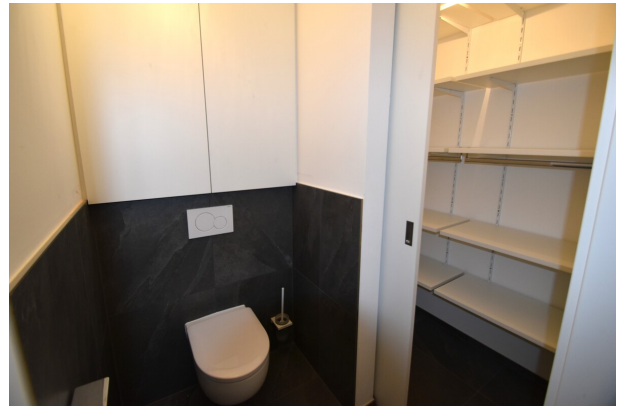
WC mit Abstellmöglichkeit