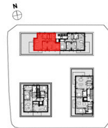
ÜBERSICHT (ohne Maßstab)